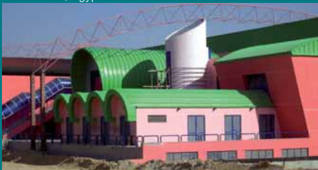
Power Plant, Egypt