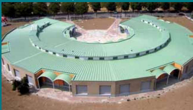
Scuola d'infanzia, Rho, Itálie